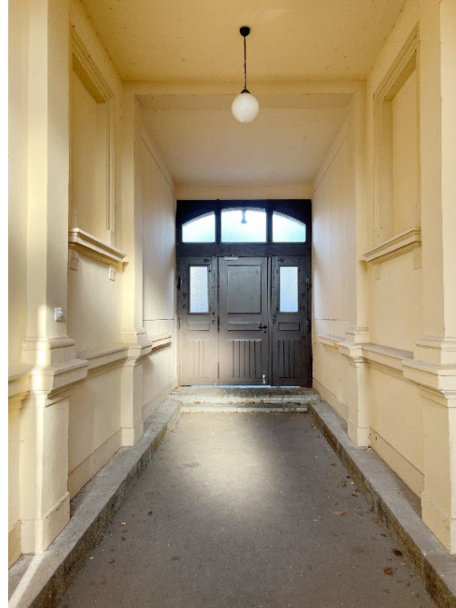
Durchgang zum Hinterhof