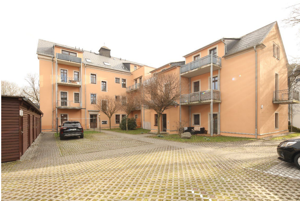
Stellplätze im Hof