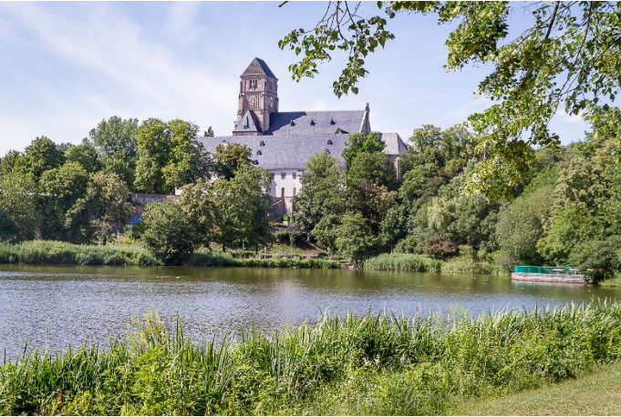
Schloßkirche und Schloßteich